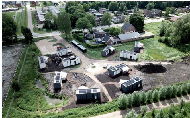
De Tiny Houses vanuit de lucht