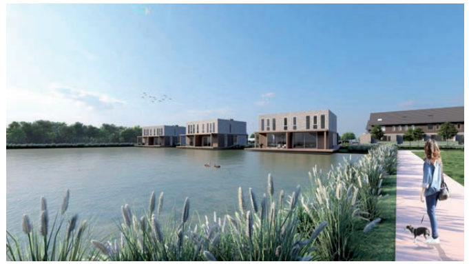
Watervilla's/architect AAS Groningen

De projectontwikkelaar heeft een informatie- en verkooppunt ingericht in het voormalige kantoorgebouw van De Eendracht aan de Woldweg. Dit is iedere vrijdag van 15:00 tot 17:00 uur geopend. Meer informatie kunt u vinden via www.woonlandschap-eendracht.nl .