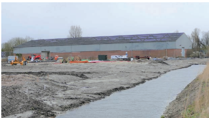
De sloop van de loods in volle gang