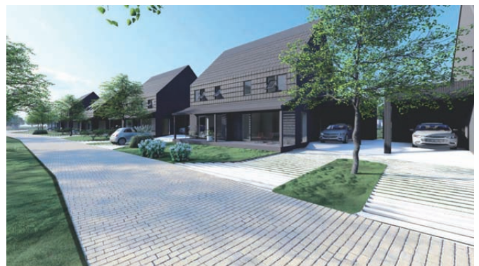
Verandawoningen/architect AAS Groningen