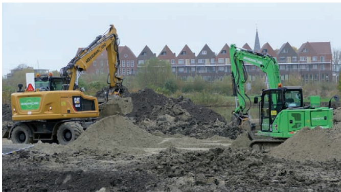
Het bouwrijp maken van de grond voor de eerste fase woningbouw

Langs de Woldweg is nog een aantal percelen waarvoor op dit moment een woningontwerp wordt gemaakt. Deze woningen maken deel uit van woonveld 5 (zie kaartje). We verwachten na de zomer meer duidelijkheid te geven.