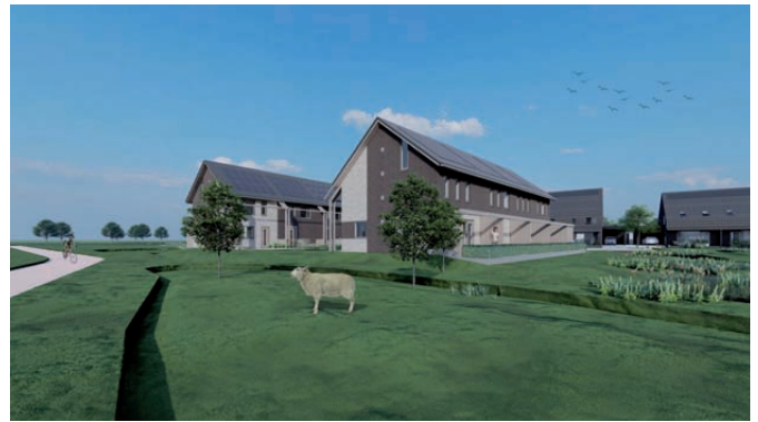
Parkwoningen/architect HJK Architecten