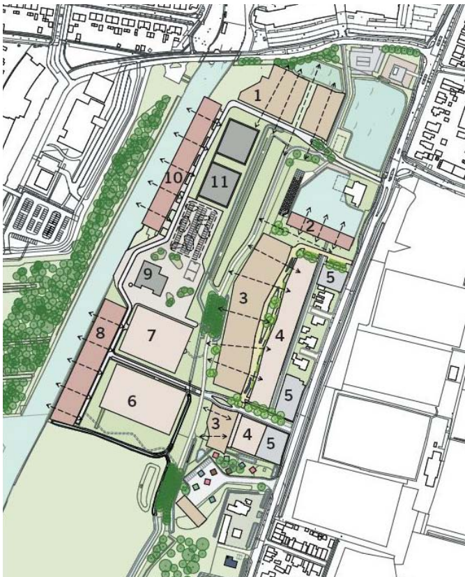
Overzicht van de woonvelden

Locatie De Eendracht wordt in fases ontwikkeld. De architect is nu bezig met de volgende fase, de ontwerpplannen voor woonvelden 6, 7 en 8 (zie kaartje). In dit gebied liggen onder meer de waterbassins. Het uitgangspunt is om deze bassins in de woningontwerpen te verwerken. Het volgende deelproject is de sloop van de voormalige warmtekrachtcentrale WKC. Ter voorbereiding daarop is onderzoek gedaan of er ook beschermde diersoorten in en rond het gebouw aanwezig zijn. Dan gaat het bijvoorbeeld om zwaluwen, kerkuilen en vleermuizen. Een gespecialiseerd bureau is daarbij betrokken. Na de zomer hopen we daarover meer informatie te kunnen geven.