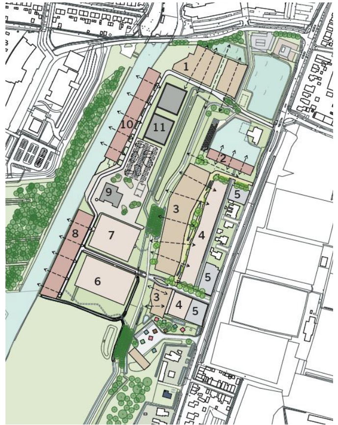
Overzicht van de woonvelden

Zorgorganisaties De Zijlen, 's Heeren Loo en De Hoven willen samen zorggebouwen bouwen die aardbevingsbestendig, duurzaam en levensloopbestendig zijn op deze locatie. Alle informatie over het Groninger Zorgakkoord vindt u op de website www.gza.nl .