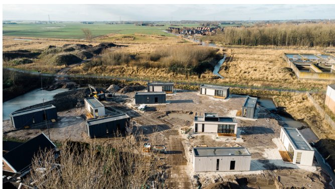
Tiny Houses op locatie De Eendracht

Woonstichting Groninger Huis heeft begin dit jaar op locatie De Eendracht tien Tiny Houses geplaatst voor de verhuur. Een Tiny House is een klein maar volwaardig huis om permanent in te wonen. Gebouwd om eenvoudig te leven met minder spullen om je heen. De Tiny Houses worden in de zomer aangesloten op de nutsvoorzieningen. Daarna gaan ze in de verhuur en wordt de bestrating, het groen en de straatverlichting aangelegd. Er is veel belangstelling voor wonen in een Tiny House. Groninger Huis heeft inmiddels een aantal kandidaten geselecteerd die in aanmerking komen voor bewoning.